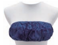
ペーパーブラ(紺) (他2色/全3種)