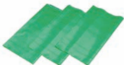
パラフィンシート(グリーン) (他4色/全5種)

全32種類を廃棄処分(焼却)する際に発生したCO2をお客様の代わりにオフセットします。(昨年度実績300トン)