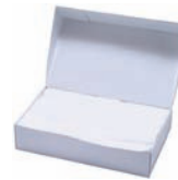
ピロシート(スリット入り)