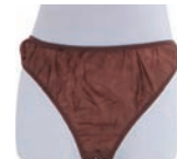
ペーパーショーツ(ブラウン) (他3色/全4種)