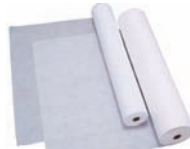
ベッドシート(薄) (全5種)