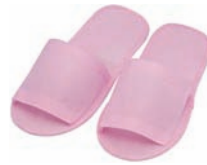
スリッパ(ピンク) (他2色/全3種)