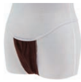
Tバック(ブラウン) (他2色/全3種)