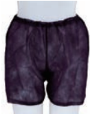
ペーパーパンツ(ブラック) (他2色/全3種)