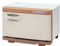
ホットメイト(S・ミルクティ) (他4機種/全5機種)

全18機種1年間電力を消費する際で排出されるCO2をお客様の代わりにオフセットします。(昨年度実績102トン)